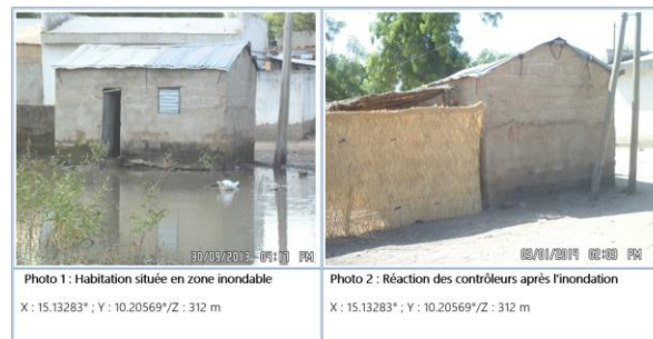
Clichés : Ovono Nogo, Yagoua septembre 2013, janvier 2014

Une analyse faite de la loi n°2004/003 du 21 avril 2004 régissant l'urbanisme au Cameroun précise pourtant dans son titre 1, chapitre 1 en son article 9 alinéa 1, les règles générales de construction; ainsi sont inconstructibles, sauf prescriptions spéciales, les terrains exposés à un risque naturel (inondation, érosion, éboulement, séisme, etc.); la même loi dans son titre 2 en son article 53 alinéa 1 et 2 définit les actes de restructuration et de la