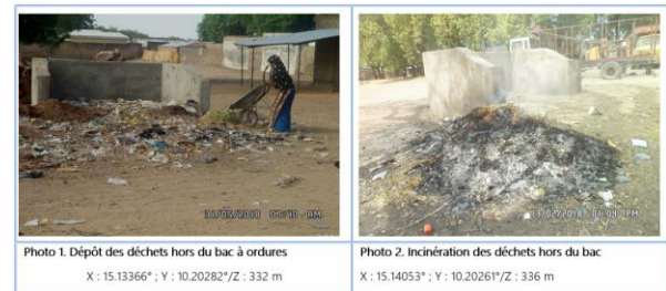
Clichés : Ovono Nogo, Yagoua, février et avril 2018

Incivisme social des populations : Productrices de déchets domestiques, les populations urbaines sont appelées au strict respect des conditions de mise en poubelle devant leur concession et dans les sites de dépôt. Elles sont aussi soumises au respect des normes d'hygiène publique, au paiement des redevances et taxes, à la participation aux activités de salubrité et d'hygiène du quartier. Cependant, malgré les efforts faits par l'exécutif communal, les populations adoptent des comportements inciviques caractérisés par le rejet des déchets hors des bacs construits (cf. photo 1) ou préfèrent plus les incinérer (cf. photo 2).